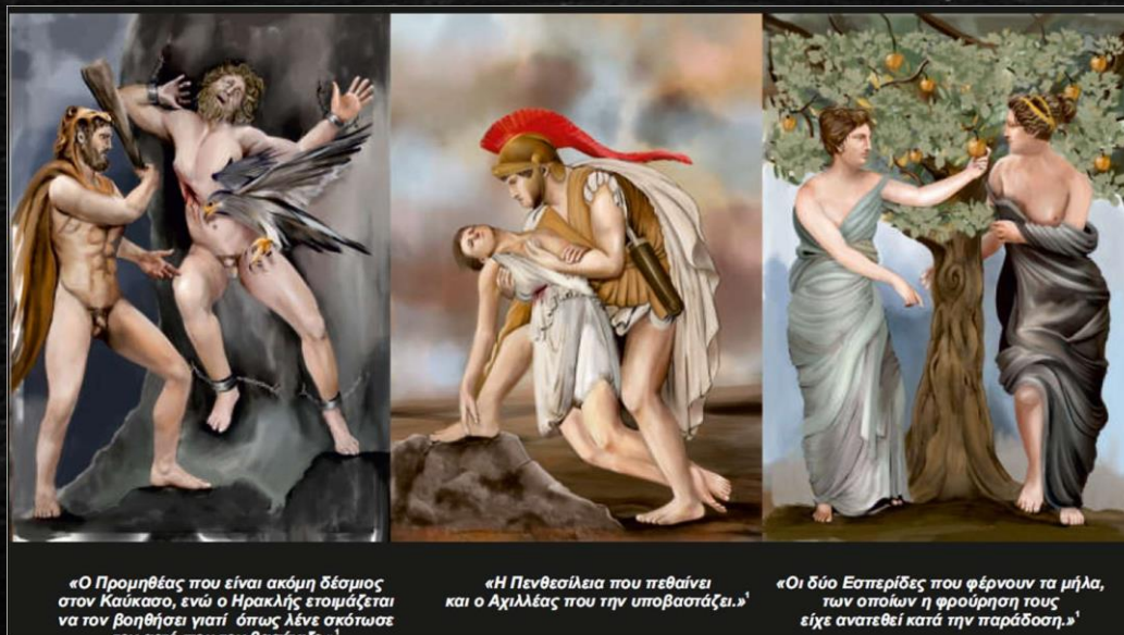
«Ο Προμηθέας που είναι ακόμη δέσμιος στον Καύκασο, ενώ ο Ηρακλής ετοιμάζεται να τον βοηθήσει γιατί όπως λένε σκότωσε τον πατέρα του Βασάνιζε.»