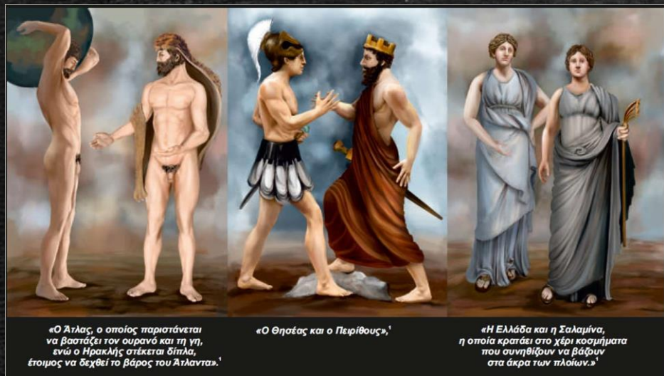
«Ο Άτλας, ο οποίος παριστάνεται να βαστάζει τον ουρανό και τη γη, ενώ ο Ηρακλής στέκεται δίπλα, έτοιμος να δεχθεί το βάρος του Άτλαντα.»