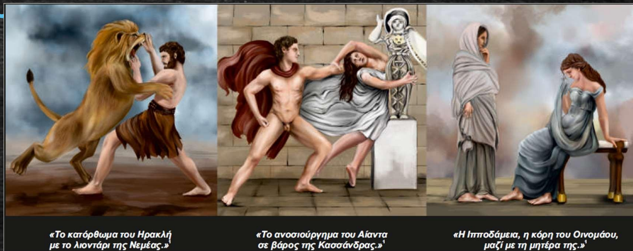
«Το κατόρθωμα του Ηρακλή με το λιοντάρι της Νεμέας.»