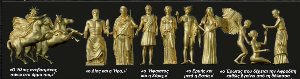
«Ο Ήλιος ανεβασμένος πάνω στο άρμα του.» 1