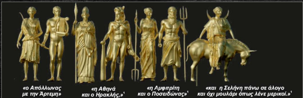
«ο Απόλλωνας με την Άρτεμη» 1