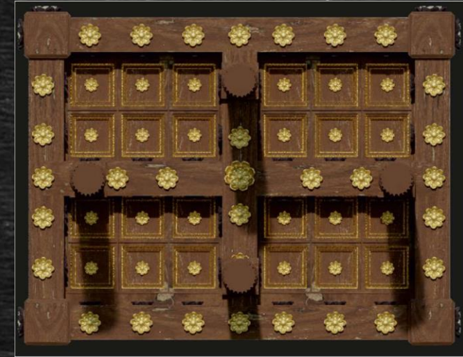
Φωτογραφική απεικόνιση της οροφής της βάσης του θρόνου του χρυσελεφάντινου αγάλματος του Δία

Με τη σύνθεση των παραπάνω στοιχείων συνθέτουν οι μαθητές που έχουν λάβει τις ιστορικές και αρχαιολογικές πληροφορίες για το χρυσελεφάντινο άγαλμα του Δία, την εικόνα που είχαν οι αρχαίοι Έλληνες για ένα από τα αρχαία θαύματα.