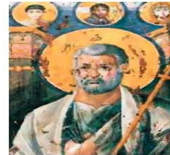
Άγιος Πέτρος. Ι.Μ. Αγ. Αικατερίνης, Σινά 6ος αιώνας

Και επέμεναν καρτερικά συνεχώς στη διδαχή των αποστόλων και στην κοινωνία και στο κόψιμο με τα χέρια του άρτου και στις προσευχές.