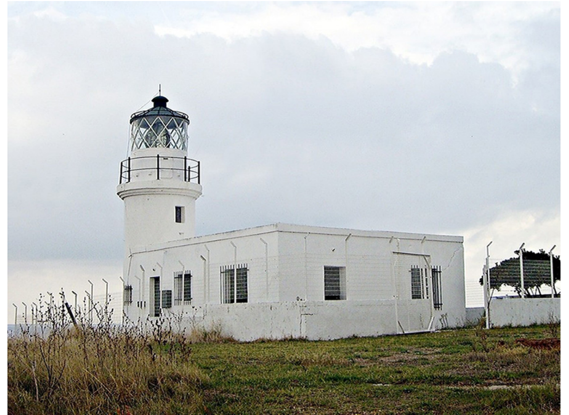
Φάρος Μεγάλο Έμβολο (Θεσσαλονίκη)