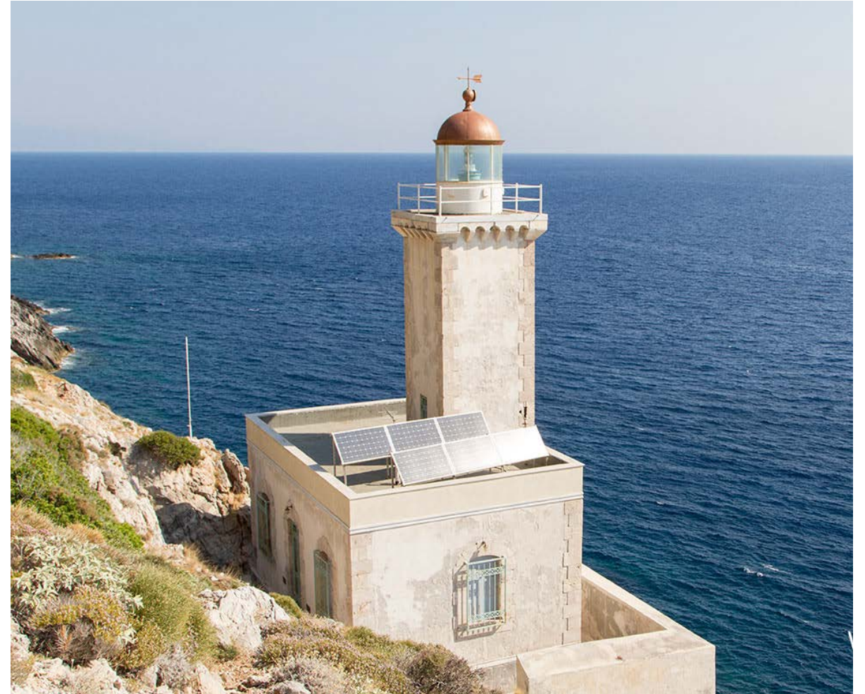
Φάρος Καβομαλέα