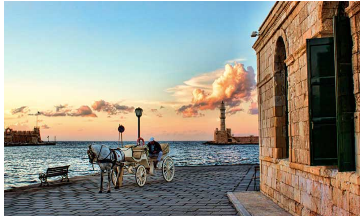
Φάρος Χανίων