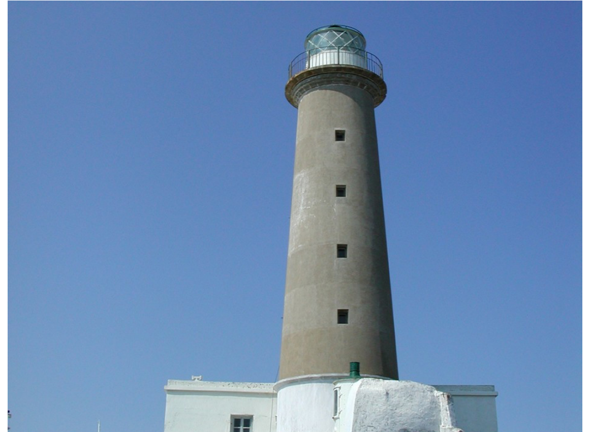
Φάρος Πλάκας (Λήμνος)

«Μοχλός» για την ενεργοποίηση και την ανάπτυξη νοητικών και συναισθηματικών αντιδράσεων και λειτουργιών σε εκπαιδευομένους/ες κάθε ηλικίας