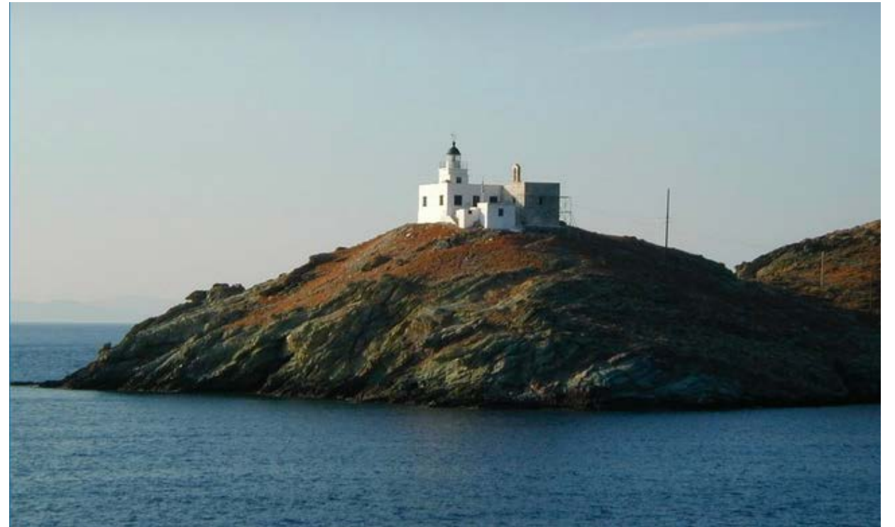
Φάρος Κέας (Υπηρεσία Φάρων, χ.χ.)