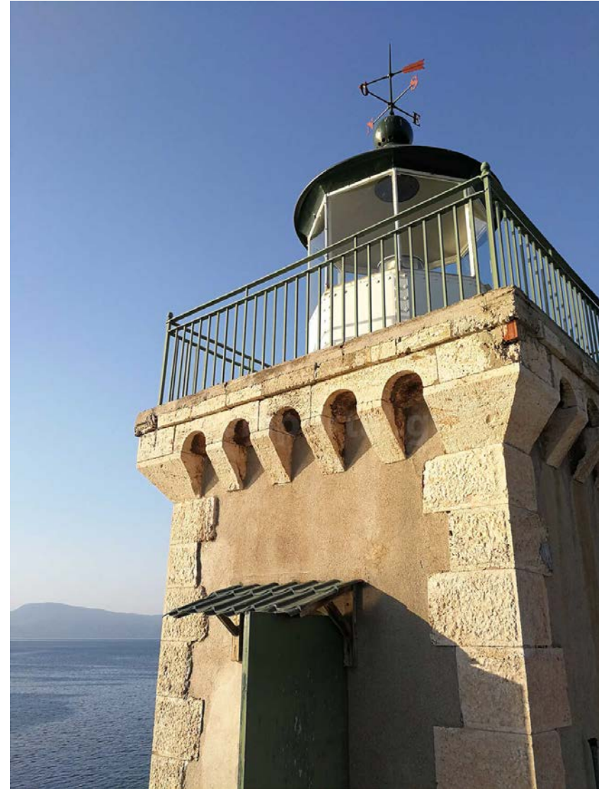
Φάρος Χαλκίδας