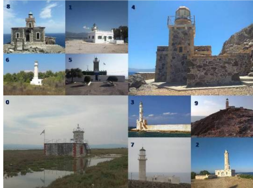
Φάροι από τις 10 Περιοχές του Ελληνικού Θαλάσσιου Χώρου 0: Κόπραινα, 1: Δρέπανο, 2: Κρανάη, 3: Χανιά, 4: Μονεμβασιά, 5: Αρκίτσα, 6: Κασσάνδρα Χαλκιδικής, 7: Σίγγρι Λέσβου, 8: Λιβάδα Τήνου, 9: Πρασονήσι Ρόδου