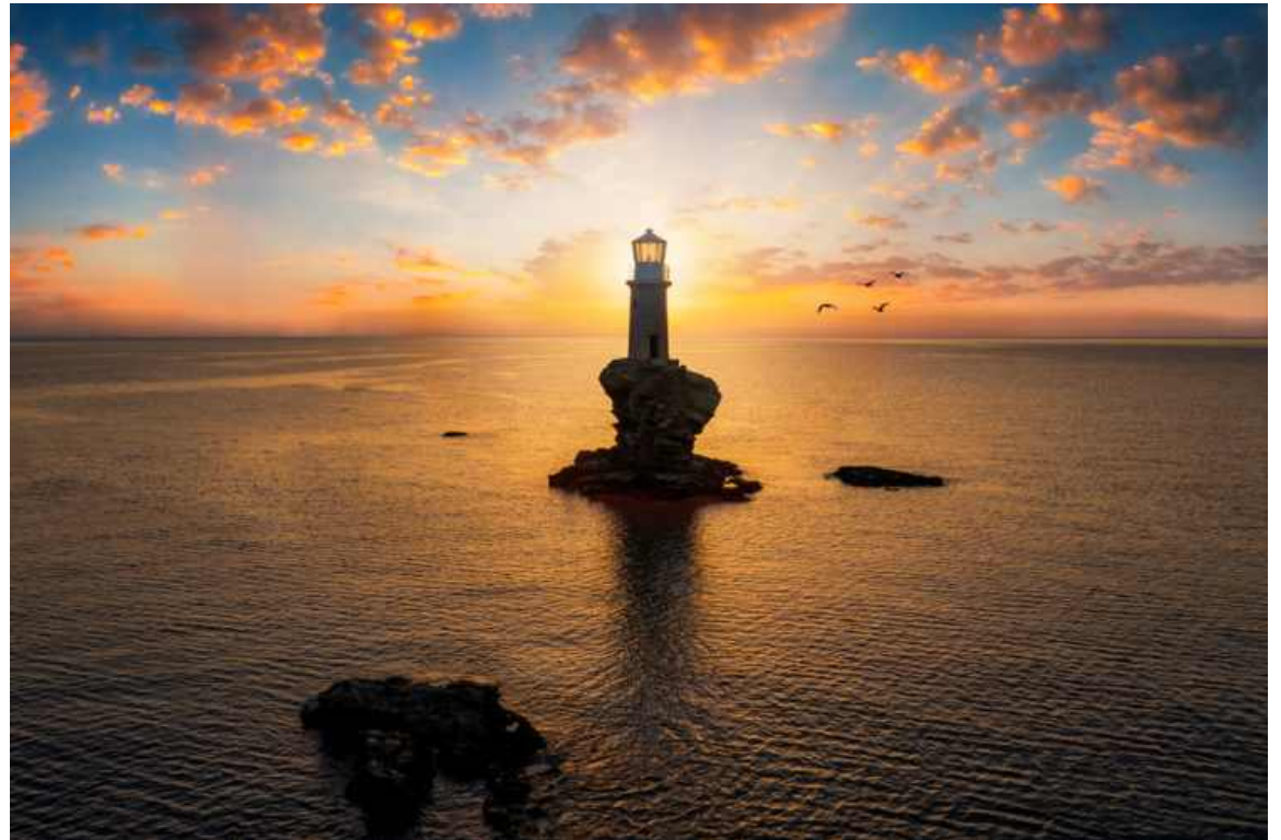
Φάρος Τουρλίτης (Άνδρος)