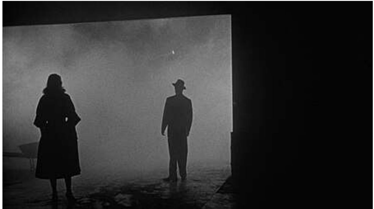
Σκηνή από την ταινία Αριστοκράτες του Εγκλήματος του Τζόζεφ Λιούις, 1955